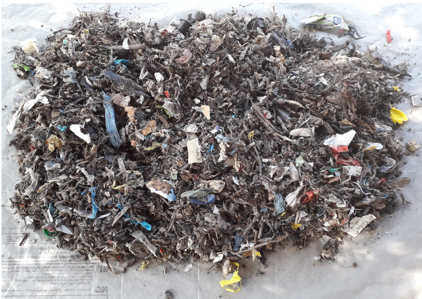
CAMPIONE MEDIO COMPOSITO